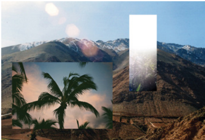
El Elqui no quiere palmeras del puerto Collage digital de fotografías análogas 35 mm. 60 x 90 cm 2020 – Londres, Reino Unido