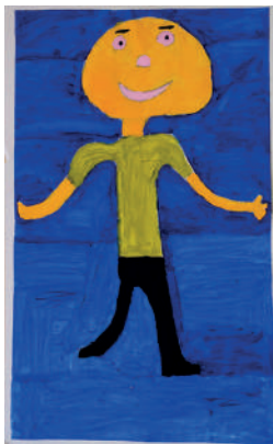
BRYAN LAGOS Locura Pintura 45 x 25 cm