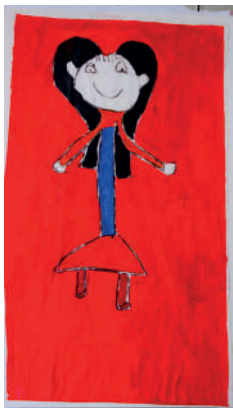
DIANA LASTRA Autorretrato Soy Feliz Pintura 45x 25 cm