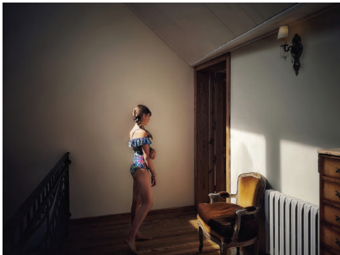
Lupe Fotografía Medidas variables 2019