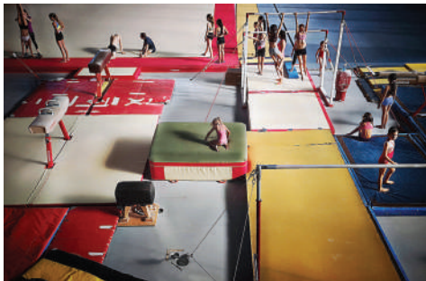
Geometría Humana Fotografía Medidas variables 2018