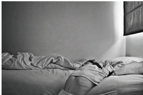
La Infancia Fotografía Medidas variables 2019