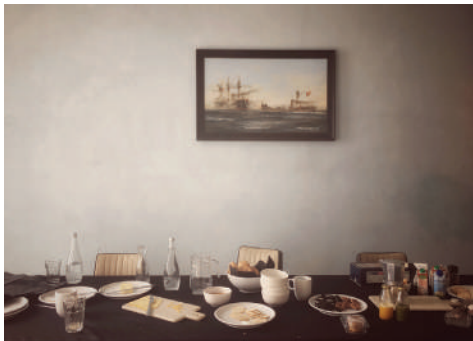
21 de Mayo Fotografía Medidas variables 2016