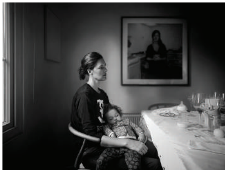
El Abrazo Fotografía Medidas variables 2019