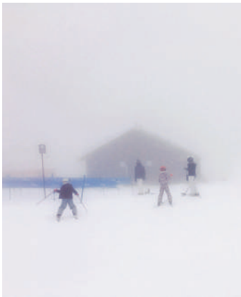
Una semana en la nieve